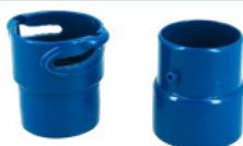
Schlauchadapter Standard und Twist Lock