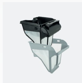
Filterkorb Zweistufige Filtration: 150/60 µ